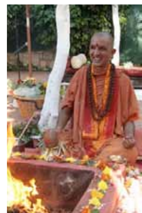
■ Swami Niranjan pendant un célébration Havan

J'ai eu l'immense privilège de passer ces mois auprès de maîtres accomplis, swami Niranjan,